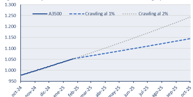
Figura 3. La baja del crawl reduce fuerte el TC en el largo plazo

Somos optimistas con respecto al sendero de la inflación para el 2025 y esperamos que la variación anual cierre en torno al 20%. Sin embargo, cabe destacar que la apreciación derivada de la reducción del crawling al 1% es significativa (figura 3) y podría tener efectos nocivos sobre la competitividad. De todos modos, creemos que el Gobierno está al tanto de ello, por lo que buscará mantener o mejorar la competitividad mediante la reducción de impuestos y liberalización del comercio exterior.