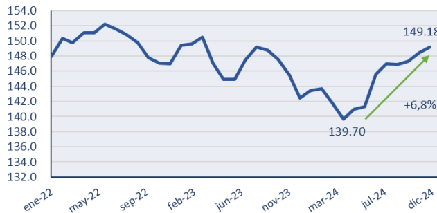
Figura 1. Continúa el rebote de la actividad EMAE sin estacionalidad

El Estimador Mensual de Actividad Económica (EMAE) registró en diciembre el mayor incremento interanual desde septiembre 2022, al aumentar 5,5% respecto a diciembre del 2023. En la medición mensual desestacionalizada, la actividad creció 0,5%, continuando la recuperación observada en el segundo semestre del año e incrementándose en un 6,8% respecto al piso de abril (ver Figura 1).