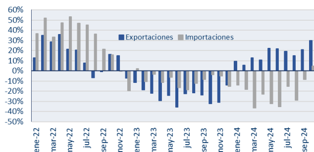
Figura 2. Excelente desempeño exportador y recuperación de impo. var. interanual

Las ventas al exterior lograron un aumento interanual del 30%, marcando el mayor registro en dos años y medio (figura 2). El rubro destacado fue Manufacturas de origen agropecuario, que aumentó sus ventas en casi 70%. Las exportaciones de Manufacturas de origen industrial y de Combustibles y energía también aumentaron (+22,4% a/a y +2,9% a/a, respectivamente), mientras que las ventas de Productos primarios se incrementaron apenas 1,8% por cuestiones de estacionalidad.